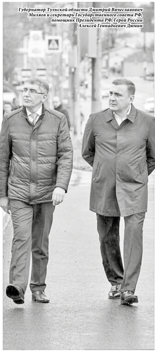
Губернатор Тульской области Дмитрий Вячеславович Милоев и секретарь Государственного совета РФ, помощник Президента РФ, Герой России Алексей Геннадиевич Дюмин