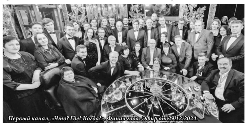
Первый канал, «Что? Где? Когда?», Финал года. Эфир от 29.12.2024.